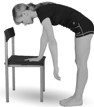
Упр. 10а. Выполнение упражнения

Стоя около стула, наклонитесь вперед, здоровой рукой обопритесь о стул. Больную руку опустите и дайте ей свободно повисеть 10—20 секунд. Затем начните легкие маятникообразные «покачивающие» движения расслабленной больной рукой в разных направлениях: вперед-назад, потом по кругу — по часовой стрелке и против часовой стрелки (упр. 10а и 10б).