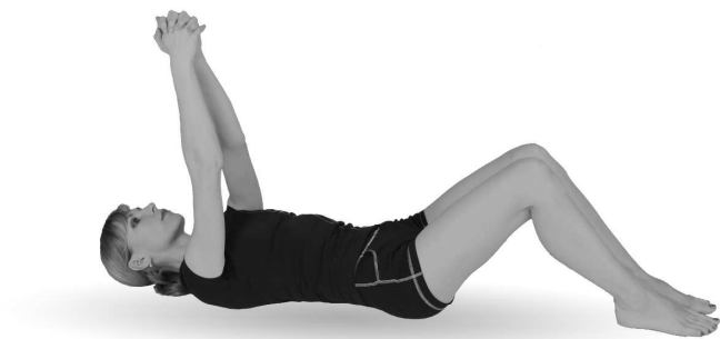
Упр. 9. Исходное положение

Не сгибая руки в локтевых суставах и не расцепляя рук, постарайтесь по возможности опустить руки за голову (упр. 9а).