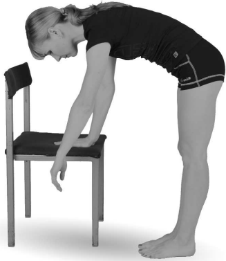
Упр. 10б. Выполнение упражнения

Постепенно увеличивайте амплитуду движений, но делайте это, не допуская явных болевых ощущений. Выполняйте такие движения 3—5 минут.