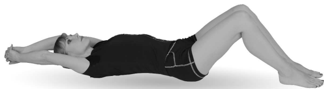
Упр. 9а. Выполнение упражнения

Не сгибая руки в локтевых суставах и не расцепляя рук, постарайтесь по возможности опустить руки за голову (упр. 9а).