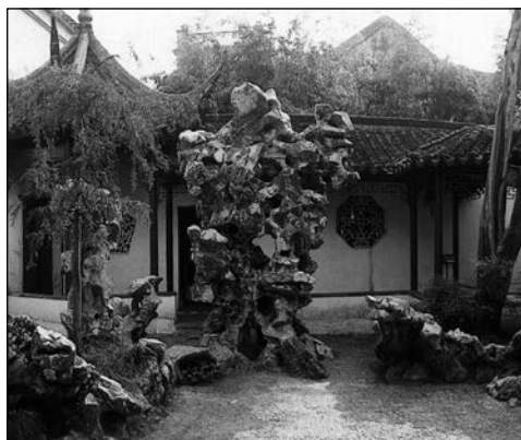
▲ 35. Сад Львиный лес. Камень хуши, носящий название Пять сосен

Философские сады Сучжоу славились на весь Восток; как говорили китайцы, они были монументальными и миниатюрными, как «лоб кошки». Ушедшие от дел мандарины создавали мир в тылке, замкнутый и беспредельный.