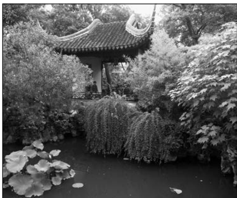
▲ 34. Китай. Сучжоу. Сад Львиный лес. Беседка

Отношение к природе как к божеству легло в основу создания миниатюрных ландшафтов-икон японскими монахами и воинственными самураями. Храмовые сады стали удивительным примером абстракций, в символах рассказывающих о явлениях природы и сложных переплетениях человеческой жизни. Особым явлением стал сад для проведения чайной церемонии, возникший в Японии в XV в. В конце эпохи Эдо (1603—1868) японские купцы и ремесленники создали искусство составления крошечных садиков при городских жилищах. Этот вид садов остался популярен и в наши дни.