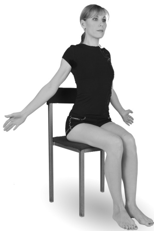
Упр. 6. Выполнение упражнения