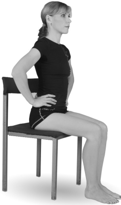
Упр. 4. Исходное положение