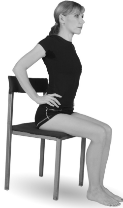
Упр. 4а. Выполнение упражнения

Важно: в указанные 5—7 секунд обязательно сохраните напряжение межлопаточных мышц , стараясь максимально свести лопатки и удерживать их в этом положении. Затем медленно вернитесь в исходную позицию и расслабьтесь.